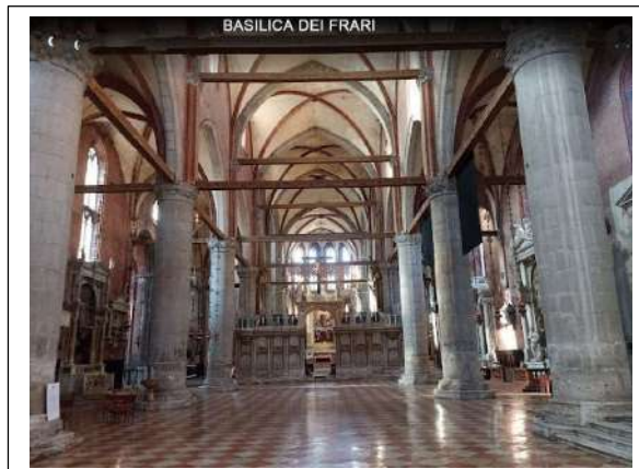
BASILICA DEI FRATI

Al pomeriggio faremo una piacevole passeggiata nel sestiere per la visita dell'attigua Scuola Grande di San Giovanni Evangelista sede dell'omonima confraternita laica da oltre sette secoli nonchè museo aperto al pubblico.